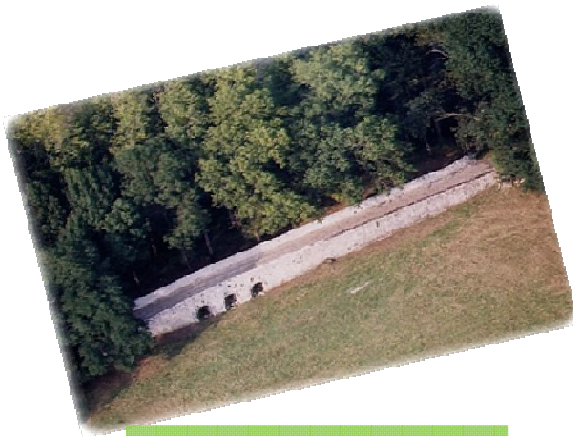
Les Ponts Chartrains

La scolarisation, des jeunes enfants, est assurée par deux Groupes Scolaires (Groupes Scolaires Des Girards ou Des Noël's) pour les classes de maternelle et élémentaire. L'enseignement secondaire des adolescents est dispensé au Collège (Collège Marcel Carné). À ces Établissements publics s'ajoute un Établissement privé (Notre Dame) doté d'une École Primaire et d'un Collège. À Vineuil, au total, 811 enfants sont scolarisés dans les écoles maternelles et primaires et 810 dans les deux collèges.