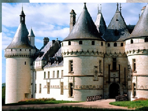
CHAUMONT SUR LOIRE