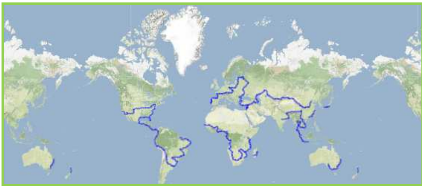
Vue d'ensemble de l'itinéraire envisagé

Quelques fois, en fonction de la météo, nous serons probablement amenés à prendre les transports en commun des pays visités. Pour la traversée des Océans, nous prendrons l'avion ou le bateau.