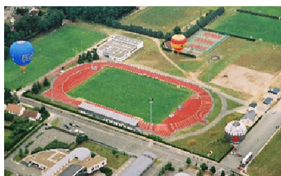
Complexe sportif de Vineuil