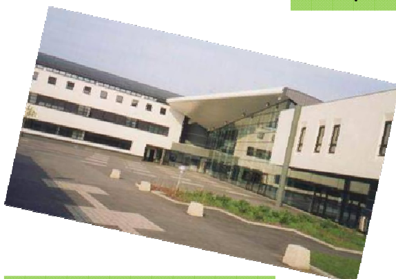
Le Collège Marcel Carné