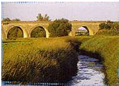
Ancien pont de chemin de fer

L'ancien pont de chemin de fer apporte au paysage du Val, une touche pittoresque. Ses arches cadrent le paysage alentour et marquent l'entrée de Blois. En plus des sites répertoriés pour leur richesse: Les Ponts Chartrains, l'Église Saint Martin..., d'autres lieux méritent le détour.