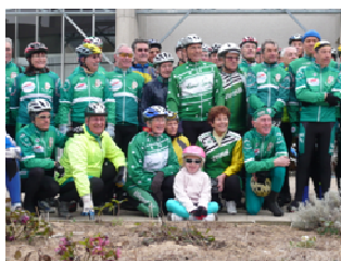
Vineuil Sports Cyclotourisme