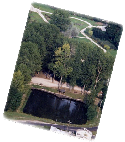
La Fosse Carrée et Le Parc Feuillarde