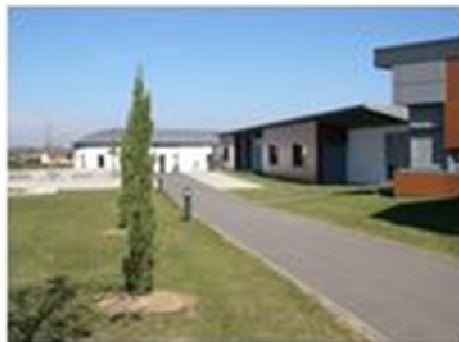
Groupe Scolaire Les Girards