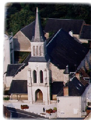
Église St Martin