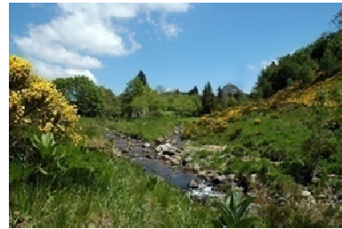
La source de la Loire

Au moment où le pouvoir royal était sur ses rives et celles de ses affluents ou à proximité, de nombreux châteaux y ont été édifiés ou retouchés. La concentration de ces monuments historiques appelés " Châteaux de La Loire " a justifié le classement du Val de Loire au Patrimoine Mondial de l'UNESCO entre Sully sur Loire (Loiret) et St-Florent-le-Vieil (Maine et Loire).