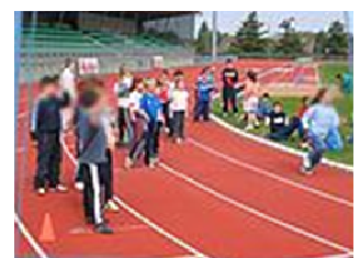
Vineuil Sports Athlétisme