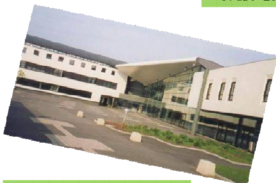
EB2/3 Marcel Carné