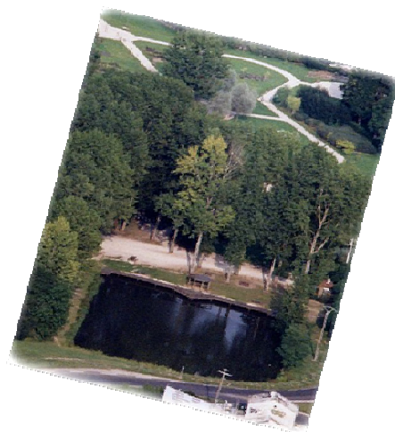
O Fosso Quadrado e o Parque