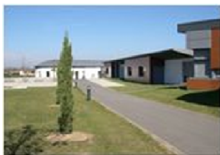
Grupo Escolar Les Girards