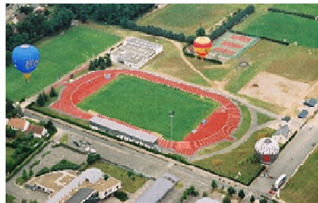
Complexo Desportivo de Vineuil

Vineuil conta com 17 associações desportivas, 1800 sócios de diferentes modalidades como cicloturismo, ciclismo, futebol, ténis; 15 associações culturais, 850 sócios em filatelia, fotografia/vídeo, artes decorativas e 17 outras associações com actividades múltiplas e diversas como "Amicale du Personnel Municipal", "Handi-Chiens", "Vineuil Environnement" entre outras.