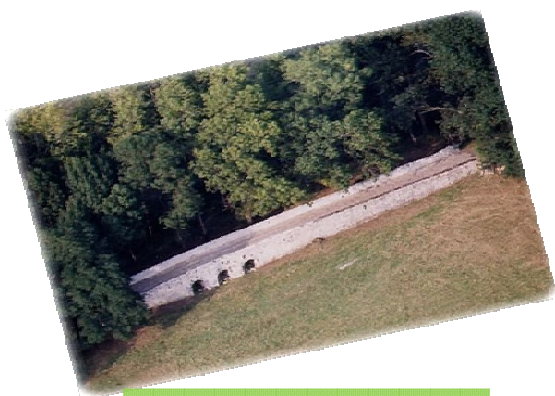
As Pontes Chartrains

A escolaridade dos mais novos é assegurada por dois grupos escolares, os "Girards ou os "Noëls" para as turmas de creche/infantário e pré-primária e primária. O Ensino Básico do 2º e 3º ciclo e Secundário encontram-se distribuídos pela Escola Marcel Carné. A estes estabelecimentos públicos junta-se um outro privado, o colégio Notre Dame dotado de uma Escola Primária e uma Escola Básica do 2º e 3º ciclo. Em Vineuil, 811 alunos têm escolaridade nas creches/infantários/pré e primárias e 810 nos restantes estabelecimentos.