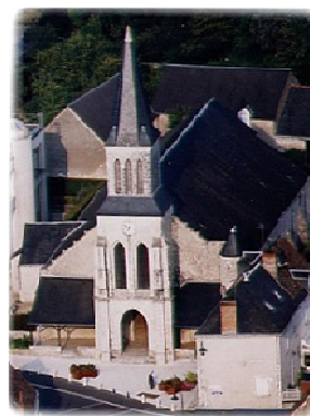
Igreja St Martin