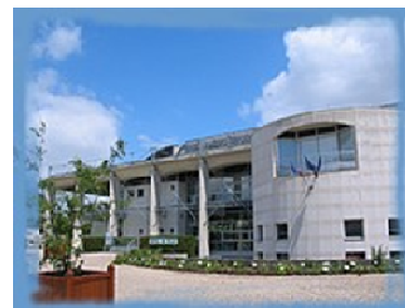
A Câmara Municipal

Residimos em Vineuil há 16 anos. Vineuil é uma freguesia com 223 hectares de superfície, conta com uma população de 6 945 habitantes, conforme o recenseamento de 2006. Situa-se na margem esquerda do rio Loire, a 6 km a sul de Blois, e insere-se entre o Vale de Loire e a Sologne. O Cosson é um riacho que atravessa Vineuil e espraia-se no Beuvron, em Candé sur Beuvron. É um afluente do Loire, cujo confluente se situa nessa freguesia. Para além da encosta limite, encontra-se o Vale de Loire que é inundável, e estende-se um planalto reservado à agricultura. A sul do território desta freguesia está a Floresta Estatal de Russy com 374 hectares. O Parque de Campismo do Lago de Loire está instalado na planície do rio Loire que recebe frequentemente turistas. Este sítio está dotado de uma área específica para prática de desportos bem como de um bar e restaurante.